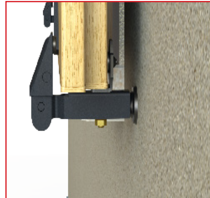
Alloggiamento persiana ad anta doppia Double leaf application